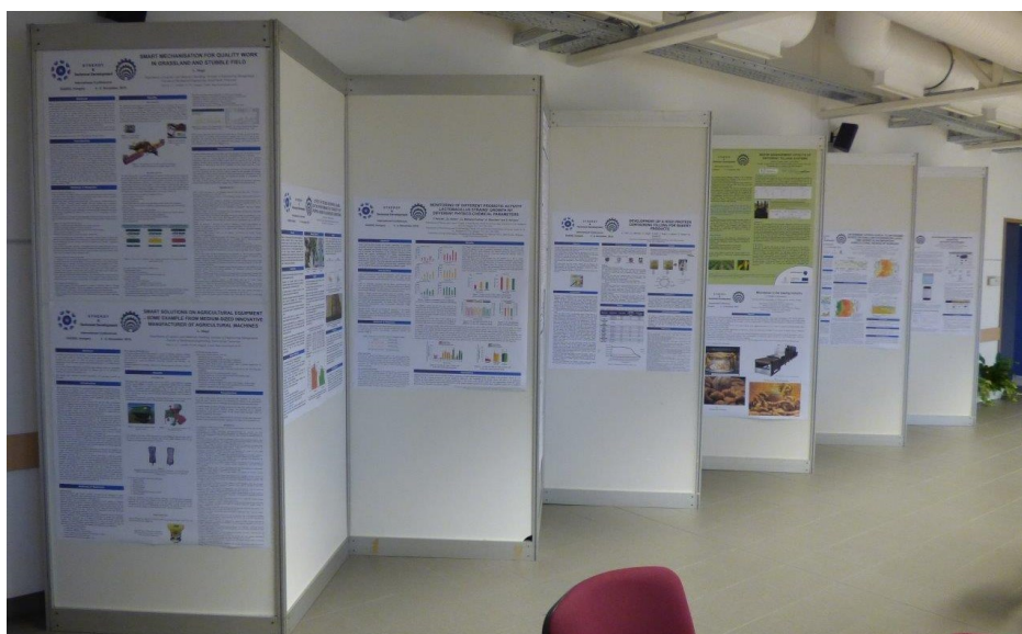
A kiállított poszterek