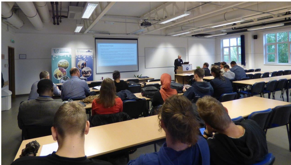
Képek a szekciókról