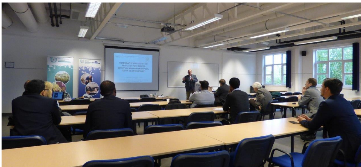
Képek a szekciókról